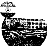
International Institute of Information Technology Bangalore