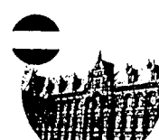
Skema Beasiswa Kominfo-StuNed